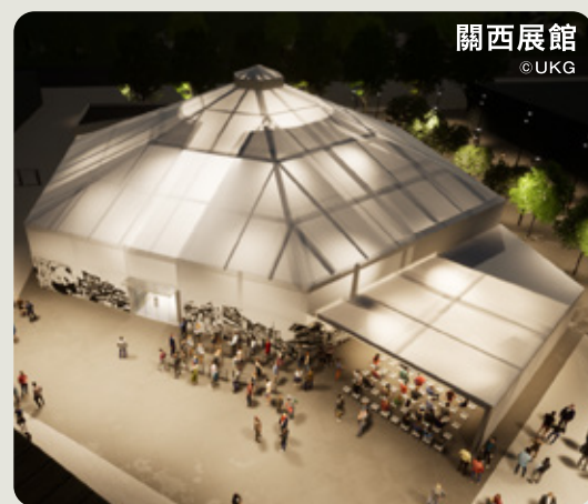
關西展館

和歌山縣的紀伊山地，自神話時代起就被認為是神靈居住的特殊所在，以寬容的心，不分宗教、身分及思維的差異，完全接納，並且融合共存了一切。我們認為，這種精神文化可以成為實現日本尊重多元價值觀的「永續的世界」的模範，並通過展示來表達這一點。 請在高品質的藝術空間裡實際感受日本精神文化的發源地，和歌山。