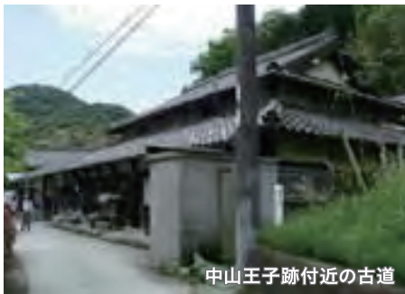
中山王子跡付近の古道

王子社とは、熊野修験者により組織された神社群で、参詣途上で儀礼を行う場であり、休憩所の役割も果たしていました。一般に九十九王子(99は実数でなく多いという意味)と言われるほど沢山の王子社が建てられていました。現存する王子社は希で、殆どは王子跡となっています。なお王子社は元来神社ですが、祭礼では神事とともに読経も行われ、神仏習合が行なわれていました。