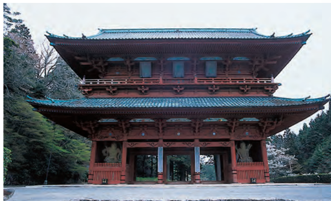
■大门 地图-① 高野山的一山总门，重建于1705年。25.8m高的木造双重门，两边安置有金刚力士像。