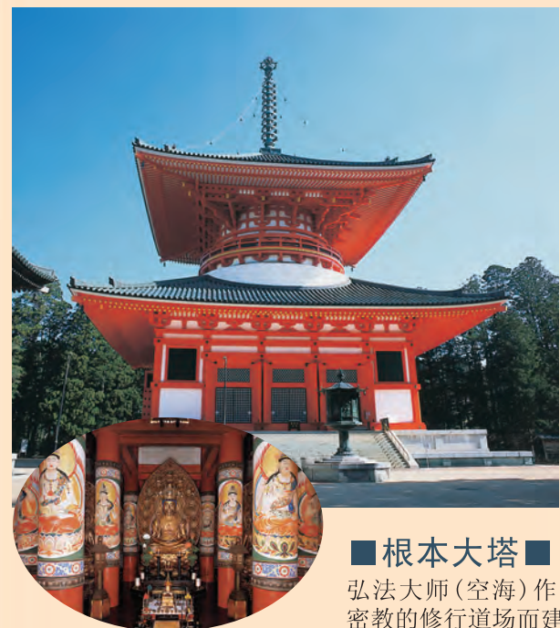
■根本大塔 弘法大师(空海)作为真言密教的修行道场而建造。道场内中央为胎藏界大日如来，四方有金刚界四佛，周围16根柱子和墙壁上绘有五彩佛身，构成了立体曼陀罗。现在的大塔重建于1937年，塔高49米，蔚为壮观，被视为真言密教的象征。