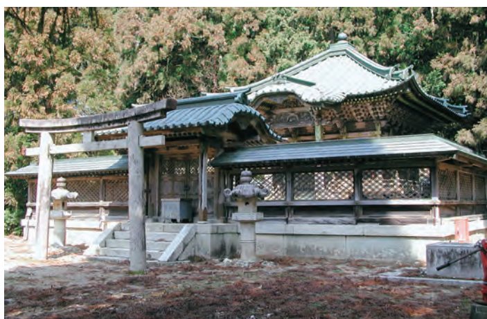
■德川家灵台 地图-⑥ 德川家耗时20年，于1643年最终建成。这里是祭祀德川家康与德川秀忠的祠堂，里面的黄金颜色耀人眼目，各细节处都有使用细致的工法。