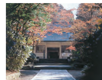
■灵宝馆 地图-② 展览，保存珍藏于高野山的国宝、重要文化财产等贵重文化遗产的设施。