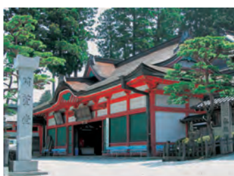
■苜蓿堂 地图-⑦ 传说苜蓿道心与石堂丸就是在这里，不表明父子身份，潜心修行佛法。堂内挂有许多描述这段故事的绘画匾额。