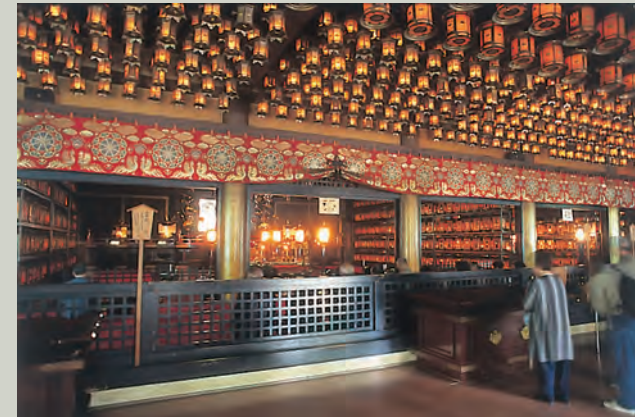
■灯笼堂 作为弘法大师御庙前的参拜堂而修建。参拜者献上的灯笼到现在已超过万盏，灯笼无息不灭，香烟袅袅。