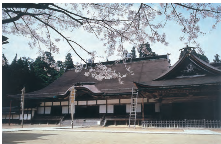
■金刚峯寺 地图-④ 丰臣秀吉为供奉亡母的菩提，在1593年建造了青巖寺。1869年更名为金刚峯寺，成为一山的大本山。金刚峯寺在全国约有3,600所连锁寺院，是高野山真言宗的总本山。