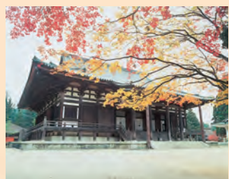
■金堂 作为弘法大师(空海)的讲堂，在819年最先建成。现在的建筑物为1932年重建，高野山的主要仪式在此进行。