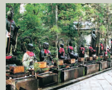
■水向地藏 御庙桥畔，排列着许多大型地藏菩萨。默默注视着桥下流水，潜心供奉着先祖之灵。

从一之桥开始，2km的参道两侧，与树龄数百年的大杉树一起，排列着超过20万座的墓碑和供奉塔，其中就有日本历史上赫赫有名的诸位大名的墓碑在内。再向里去，就是弘法大师的御庙，作为信仰的中心圣地，接受众多参拜者的朝拜。