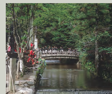
■御庙桥 走过御庙桥，就进入弘法大师(空海)的灵域所在。每块桥板背面记载着佛和菩萨的名字，代表金刚界37尊。