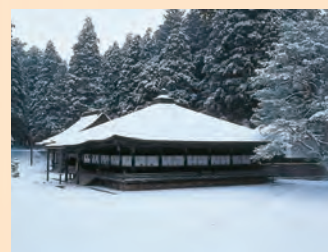
■御影堂 作为弘法大师(空海)的持佛堂、念诵堂而建造。现存的建筑物为1847年重建，平缓倾斜的曲线型房顶与深厚的房檐，勾勒出山内首屈一指的优雅经堂。