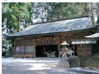
■女人堂 地图-⑤ 高野山作为修行场所，至1872年止，女性是不能进入的。因此，在7个入口处，分别设有女人堂，据说女性是从堂内进行参拜的。现存的女人堂仅此一处，让后人追思当时的情景。